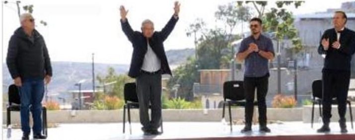
• El Gobernador, Jaime Bonilla Valdez (izquierda) y el alcalde de Tijuana, Arturo González Cruz (derecha), acompañaron al Presidente de la República.

• El presidente de la república, Andrés Manuel López Obrador, recalcó que ven con buenos ojos el gobierno de Jaime Bonilla Valdez, sobre todo medidas como el cobro a empresas de grandes adeudos por servicio de agua. 02