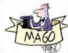
D. PRENSA/OCIO.COM | 1 482 2 2000 | INFORMATICA/OCIO.COM